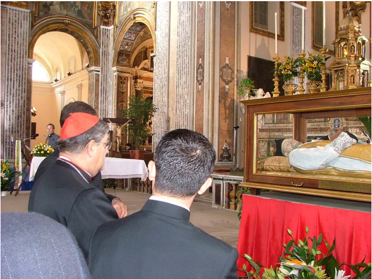
Il cardinale Crescenzo Sepe davanti alle spoglie di sant' Andrea Avellino

da Rai 1. Il 41% dei visitatori ha inserito il nostro portale tra i "preferiti".