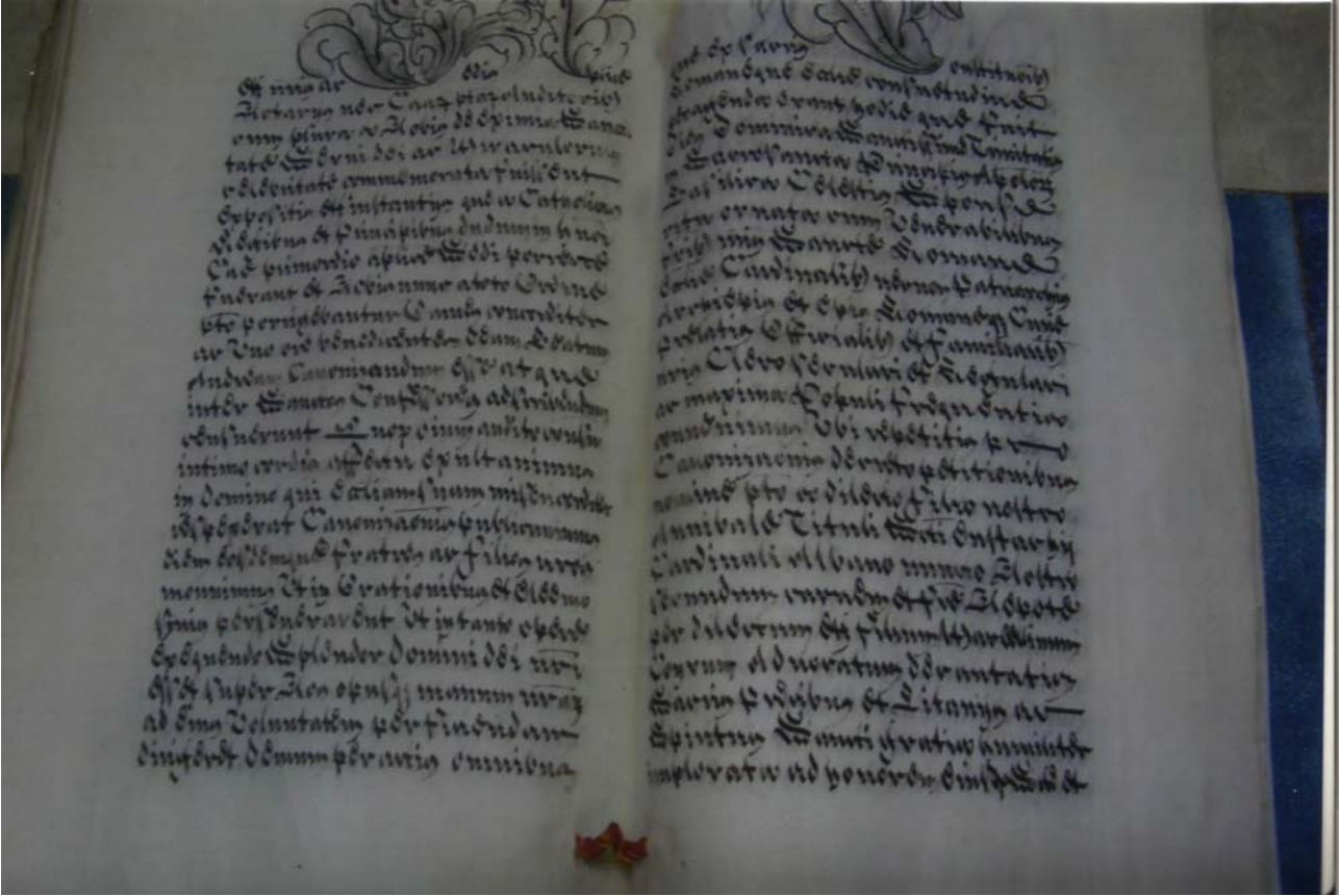
Pagine centrali della Bolla di canonizzazione