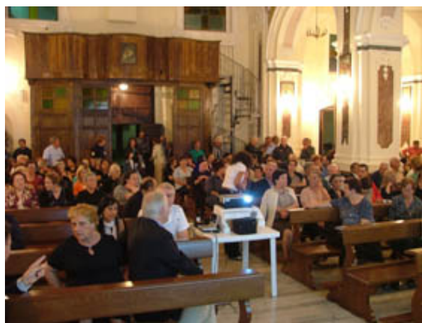
La Chiesa prima del film