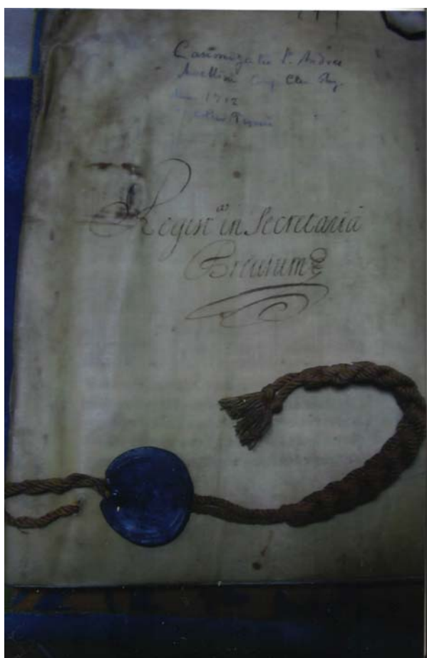
Copertina della Bolla

rivolte, allo Spirito Santo, che dentro di noi agisce e ci guida per divina misericordia, è sembrato opportuno di innalzare sul candelabro della Chiesa la fiaccola di Andrea Avellino affinché, passato con rito solenne nell'Albo dei Santi, il Mondo Cristiano possa rivolgergli suppliche e sappia di poterlo considerare sia come difensore in così grandi ed incombenti calamità, sia come aiuto al cospetto di Dio, e si affretti ad invocarlo ad avvenuta proclamazione.