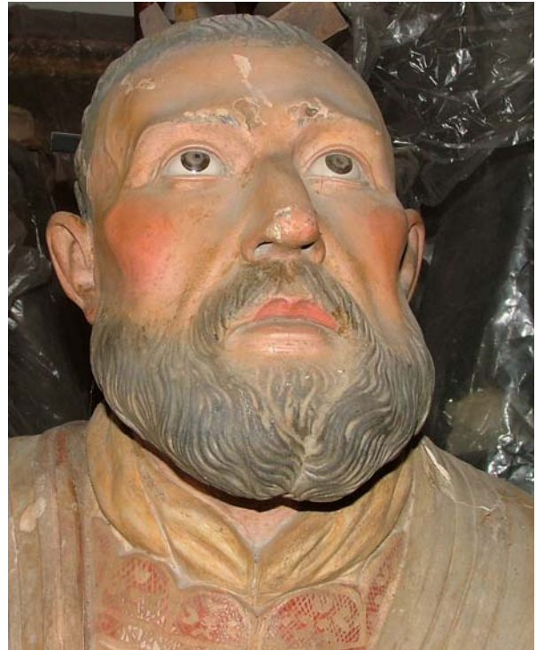
Busto da restaurare

Il 10 novembre 2007 è iniziato l'Anno Santo Avelliniano, voluto dai Chierici Regolari Teatini e arricchito dal dono dell'indulgenza plenaria, concessa dal Santo Padre Benedetto XVI, che si concluderà il 10 novembre 2008 con la ricorrenza del IV Centenario del suo transito al Cielo.