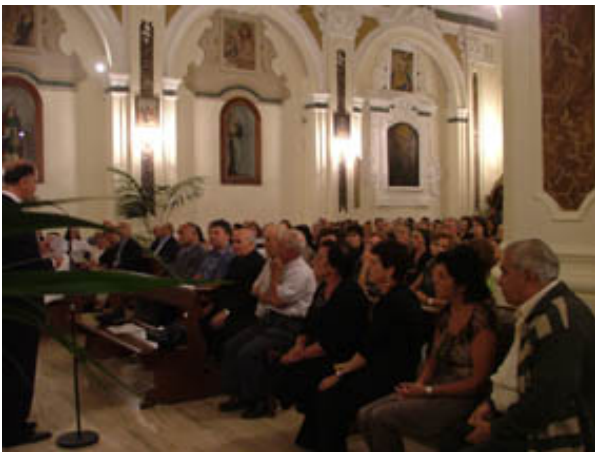
La presentazione del film

Vuole essere una preghiera corale e collettiva, in vista del prossimo Quarto Centenario del Transito al Cielo (10 novembre 2008).