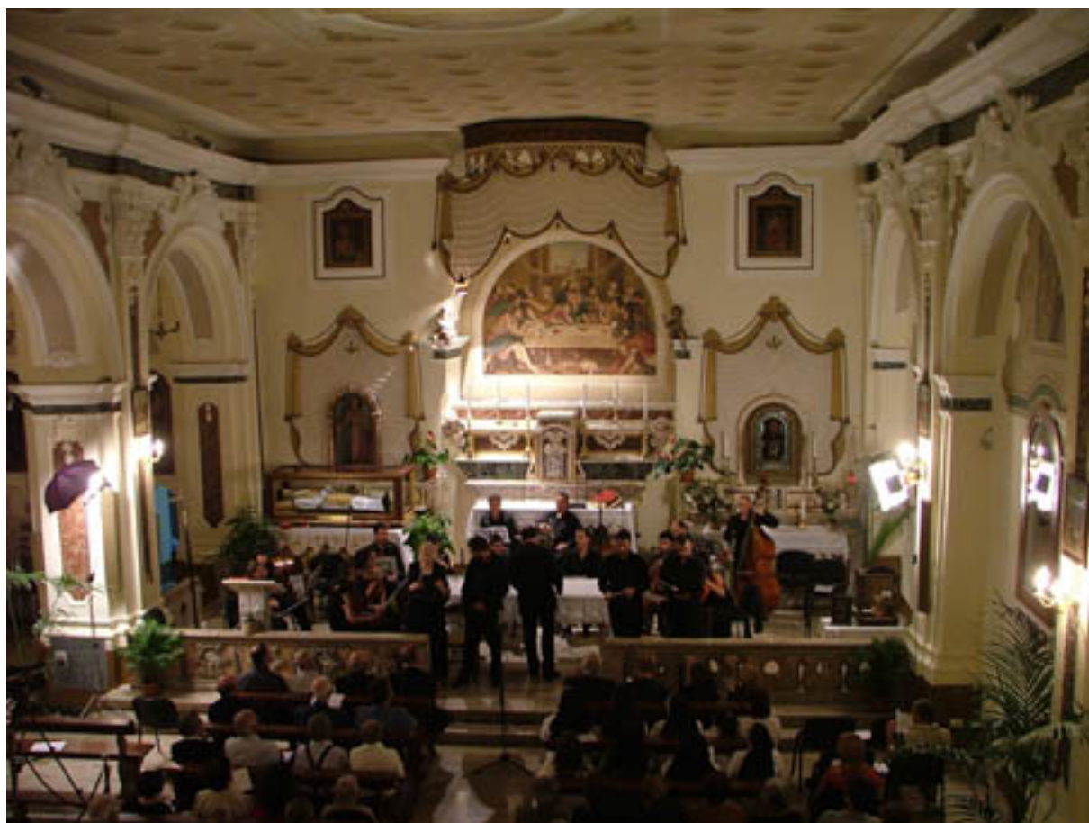
Un momento del concerto nella Chiesa Madre di Castronuovo di Sant' Andrea

Nella suggestiva cornice della Chiesa Madre di S. Maria della Neve di Castronuovo di Sant' Andrea, davanti alle spoglie del Santo, il 9 agosto 2007 si è tenuto il Concerto per Sant' Andrea Avellino e il