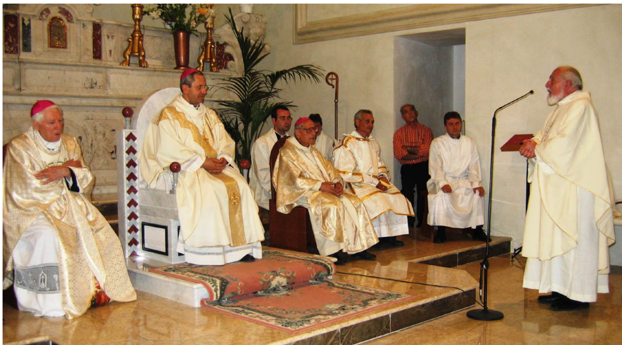
La cerimonia di nomina del Santo a compatrono della diocesi di Tursi - Lagonegro